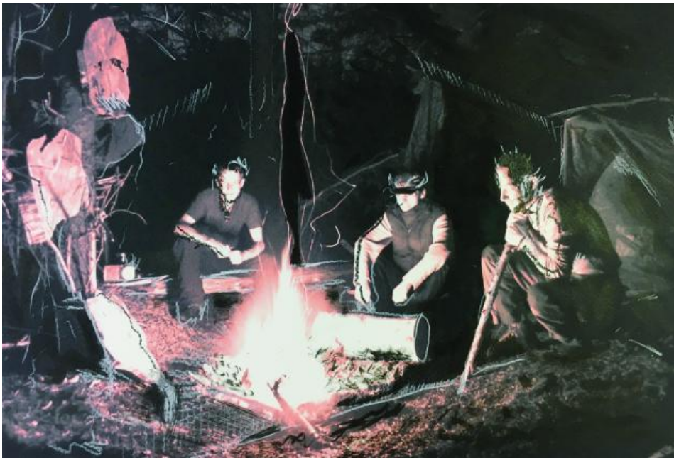
«Freak Out (On Fire) #1», 2019, Farbstift, Inkjet, Tusche auf Papier. Bild: zvg/Jerry Haenggli

«Situation» – so nennt der Bieler Künstler Jerry Haenggli (50) seine aktuelle Ausstellung in der Berner Galerie DuflonRacz. Er spielt damit darauf an, was gerade alles Ungutes in der Luft liegt.